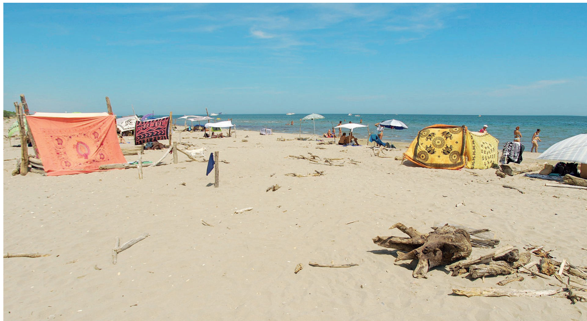
Alcune delle "capannine" che alcuni fruitori amano costruire nella spiaggia libera di Lido di Classe e residui di quelle abbattute

TURISMO E REGOLE «LOCALITÀ DIMENTICATA»: IL COMUNE NON CI STA