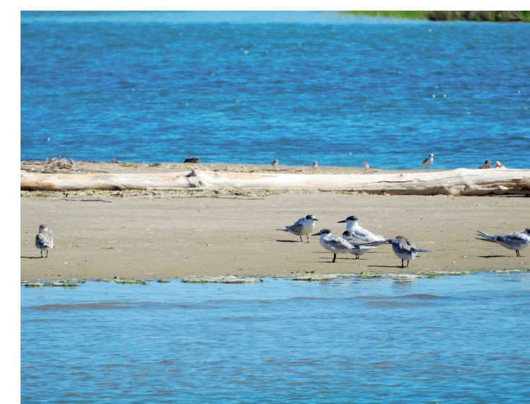
Pulli di fratino, specie protetta e rara che nidifica in zona, a Foce Bevano