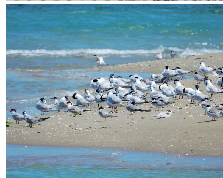
In alto guardie ecologiche presidiano la barriera con la zona rossa, a Lido di Classe. Sotto, avifauna a Foce Bevano